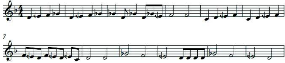
شكل ( ١ )